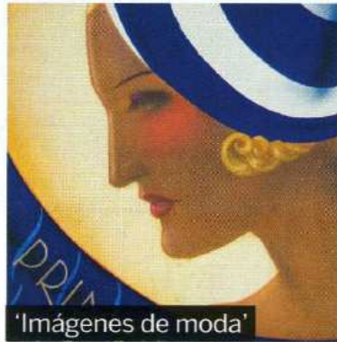
'Imágenes de moda'

Feria de Arte Contemporáneo. SWAB celebra su tercera edición cambiando de ubicación: esta vez será en el pabellón italiano de la Fira de Barcelona, del 13 al 16 de mayo.